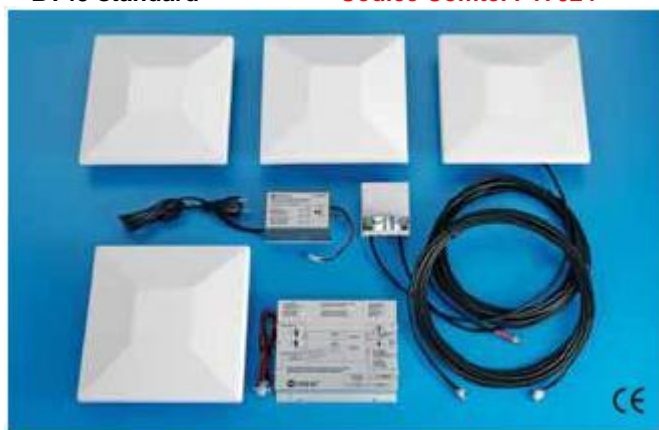
Codice Comtel P17024